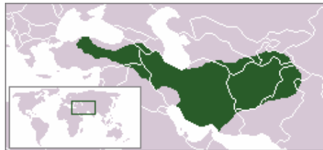
Het rijk van de Meden rond 600 v. Chr.

Zo rond 628 v. Chr. wordt er iets vernomen van Fraortes, koning van Medië, die in 625 v. Chr. opgevolgd wordt door koning Cyaxares die de opdringende Skythen teruggedrijft. In Perzië leeft nu waarschijnlijk de al of niet legendarische Zarathoestra, de grondlegger van het mazdeïsme. De twee rijken bestaan naast elkaar maar na de val van Ninevé wordt Medië de leidende macht. Maar in 559 v. Chr. weet koning Cyrus I (Kiros) vanuit Perzië een opstand te beginnen die tot samenvoeging zal leiden.