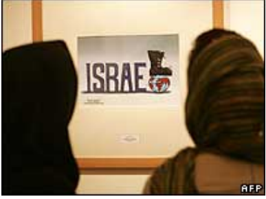
Een anti-Israël tekening

“Afgelopen maand verlieten Joden Iran. Zij moesten al hun bezittingen achterlaten”