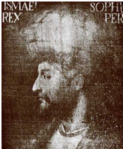
Sjah Ismail I door een Venetiaans kunstenaar