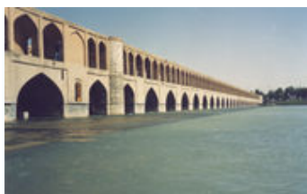
Brug over de Zayandeh Rud in Isfahan.

De Perzische Golf (Perzisch ج فارس یخل) is een uitloper van de Indische Oceaan tussen het Arabisch schiereiland en Iran (Perzië). Deze binnenzee heeft een oppervlakte van circa 233.000 km 2 en staat met de Arabische Zee in verbinding door de straat van Hormuz. Het einde van de Golf wordt gemarkeerd door de rivierdelta van de Shatt al-Arab (Arvandroed) waarin de rivieren Eufraat en de Tigris uitmonden.