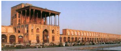
Ali Qapupaleis in Isfahan

Iran (Perzië) heeft een bijzonder lange geschiedenis en kan met recht een bakermat van de beschaving genoemd worden.