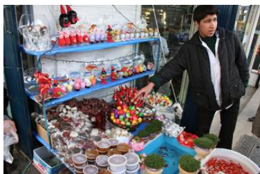
Verkoop van No Ruz-spullen, waaronder goudvissen

No Ruz wordt gezien als het belangrijkste familiefeest in Iran. Het wordt ook wel het Iraanse Nieuwjaar genoemd. Het is een pre-islamitisch Perzisch feest. Voorafgaand aan No Ruz vindt Chaharshenbeh Souri plaats.