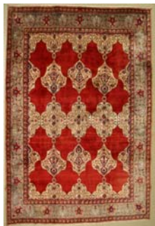
Tapijt uit Mashhad

De oorsprong van de stad is onduidelijk, maar de stad begon pas echt te groeien nadat Imam Reza, de achtste Imam van de twaalver sjieten er begraven werd. Zijn graf groeide uit tot bedevaartplaats en trok vele pelgrims.