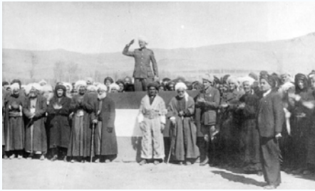
Qazi Muhammed en Mulle Mustafa Barzani bij afkondiging van Koerdische Republiek van Mahabad, 22 januari 1946

januari 1946 een regering onder de president (rechter) Qazi Muhammed, een gerespecteerd lid van een belangrijke familie in Mahabad.