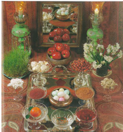
Haft Sin- een speciaal gedekte tafel met symbolen