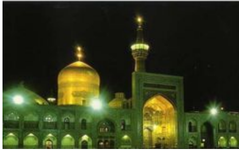
Schrijn van Imam Reza, de achtste imam van de sjieten